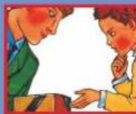
В ТРАНСПОРТЕ- ВОДИТЕЛЮ