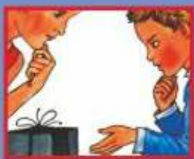
В МАГАЗИНЕ- ПРОДАВЦУ