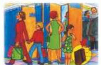
В ОБЩЕСТВЕННЫХ МЕСТАХ