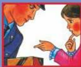
НА УЛИЦЕ ИЛИ В МЕТРО- ПОЛИЦЕЙСКОМУ